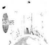
image001.jpg 8 KB