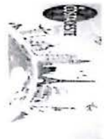
image001.jpg 8 KB