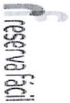
image002.png 6 KB